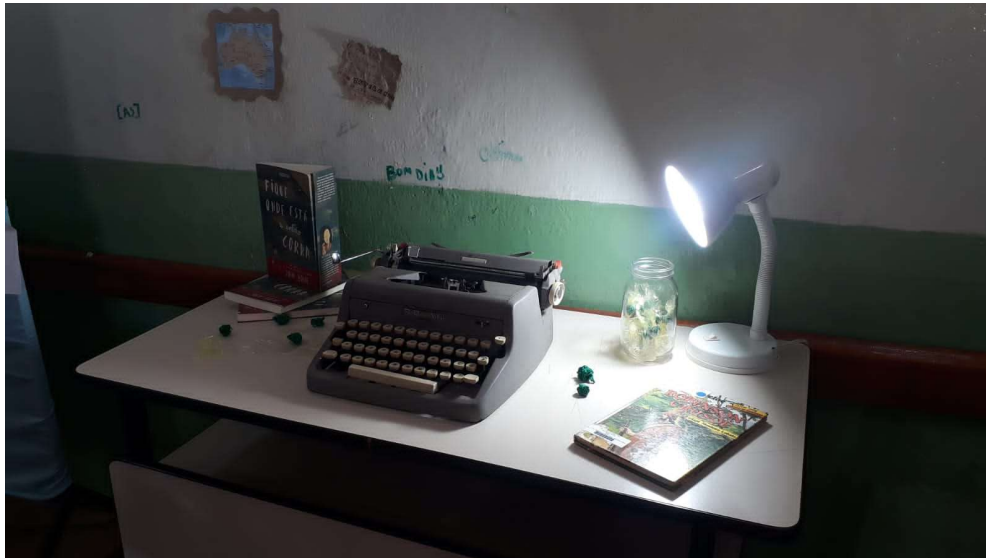
Universo de Alfie

Uma instalação planejada e montada pelas alunas e pelos alunos ocupou uma grande parte da sala. Diante dela, éramos convidados a adentrar dois universos. O primeiro, do personagem Alfie Summerfield, que vive nas páginas do livro “Fique onde está então corra” do autor John Boyne. O outro universo remeteu à vida delas e deles, alunas e alunos do 7º ano.