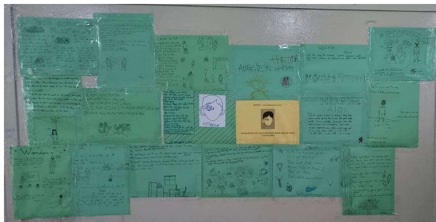
Mural de empatia construído pela turma

Numa estante da sala, podia-se observar o trabalho criterioso, na disciplina de Ciências, de organização de uma coleção já existente na escola de animais vertebrados e invertebrados, um dos conteúdos estudado durante o ano. Ali, um Museu de Ciências foi organizado, com espécimes representantes dos filós animais. Este Museu pretende se tornar uma exposição permanente da escola. Você pode acompanhar todo o processo nesse vídeo aqui: