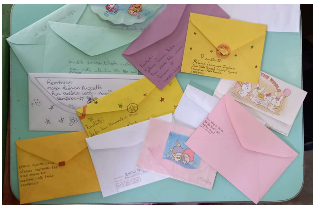
Cartas escritas ao Alfie.

Entre um universo e outro, ligando-os, estavam as cartas que escreveram ao personagem Alfie, já que ele, adolescente na época da Primeira Grande Guerra e, elas e eles, adolescentes em 2022, na época da Guerra da Ucrânia, parecem ter uma experiência em comum: crescem em uma humanidade que faz guerra.